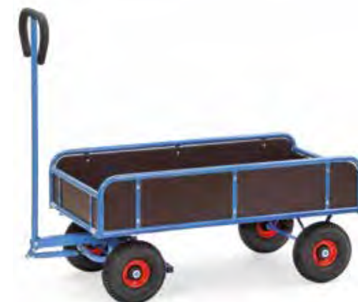
4122 | 4124

A.u.b. het bestelnr. van de handtrekwagens aanvullen met een „V“.