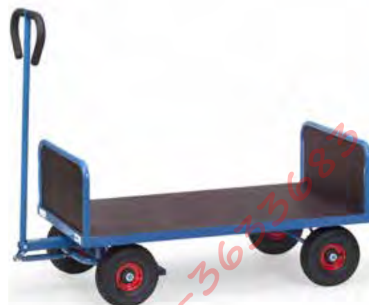
4021 | 4022