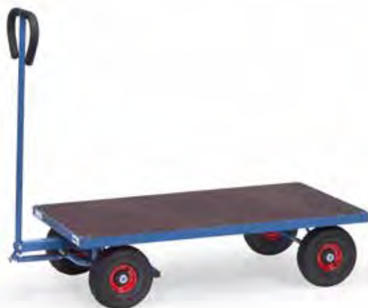
4001 | 4002

Wielen met luchtbanden, naaf met rollager. Dissel met veiligheidshandgreep, softgrip en automatische demping bij terugplaatsen in rustpositie. Automatische rem werkend op de voorwielen. Conform de Europese Norm EN 1757-3.