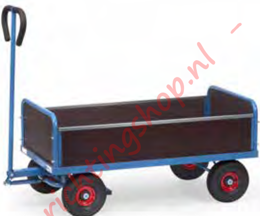
4051 | 4052

Uitvoering zoals boven, echter bijkomend met 2 insteekbare zijwanden van watervast multiplex, 220 mm hoog.