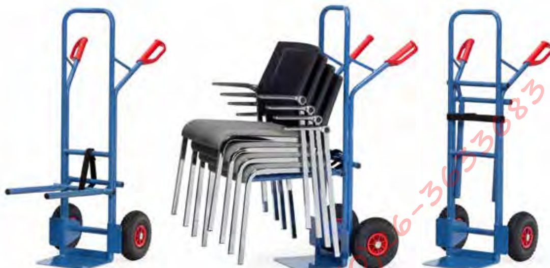
B1335V | B1335L Draagarmen inhangbaar

Draagarmen kunnen aan de wagen worden opgehangen, indien armen niet in gebruik.