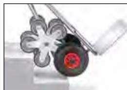
AK1327 | AK1328