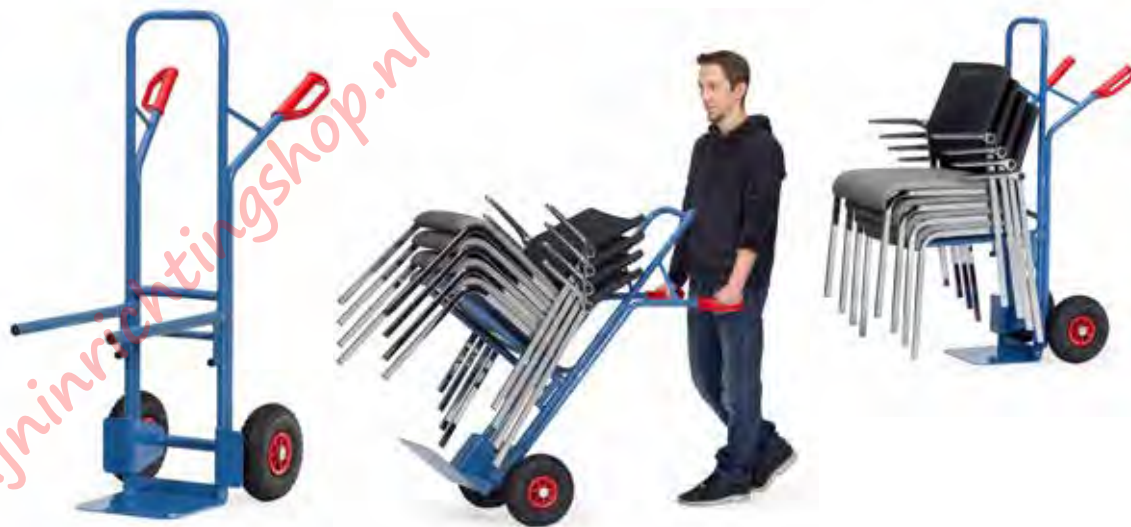
B1345V | B1345 L Draagarmen aan steekwagen geschroefd

Draagarmen kunnen aan de wagen worden opgehangen, indien armen niet in gebruik.