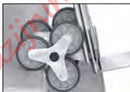
AK1325 | AK1326