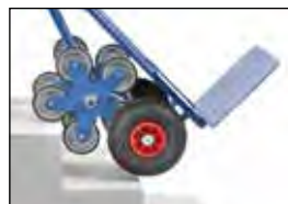
TK1327 | TK1328