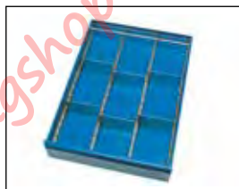
Lade indelingsset 2148ES

(2 Stuks per wagen mogelijk, bij 2496B, 2496W 2400B en 2400W 1 stuks per wagen mogelijk).