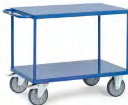
2400B | 2401B | 2402B | 2403B