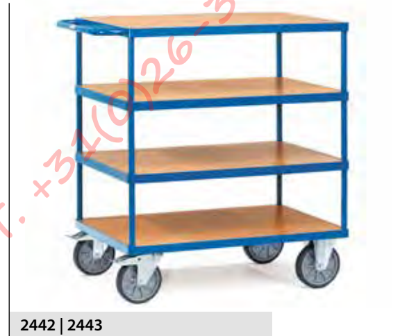
2442 | 2443