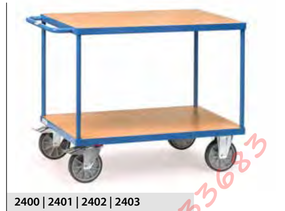
2400 | 2401 | 2402 | 2403