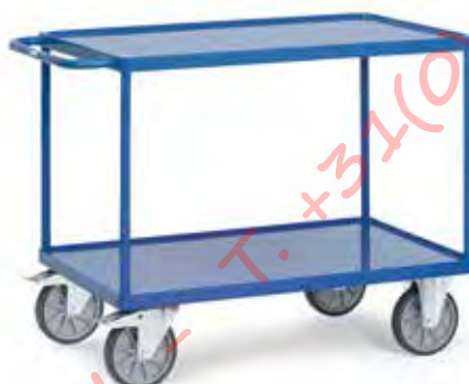
2400W | 2401W | 2402W | 2403W