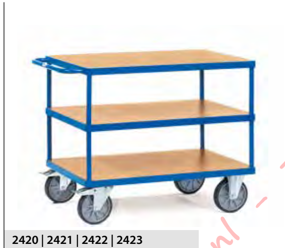
2420 | 2421 | 2422 | 2423